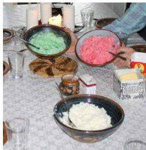
Informasjon til julegrøt

Hva er julegrøt? Vanlig grøt med rød og grønn konditorfarge i 😊. Lurt med litt hvit grøt i reserve for de som bryner litt på nesen 😊.